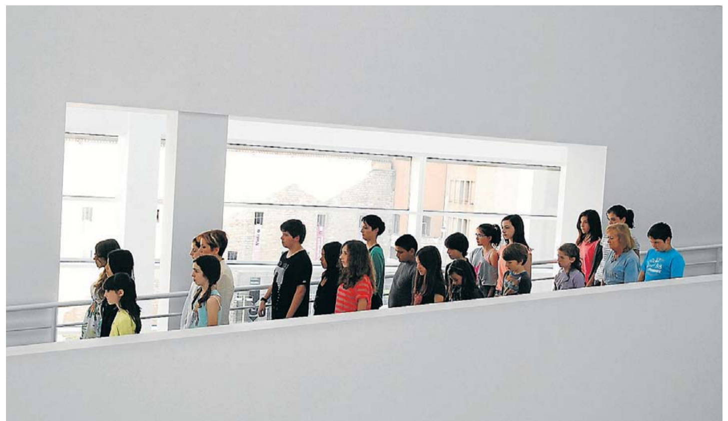
Alumnes i docents de l'institut Quatre Cantons baixen lentament per la rampa interior del Macba. Reflexionen sobre les normes que s'imposen als museus. EN RESIDÈNCIA

Ningú trobarà cap projecte artístic recent signat per Saladrigues que no reflexioni sobre la interacció que es produeix quan un, de forma buscada o per casualitat, s'acosta a l'art. Però si un procés de creació va marcar especial-