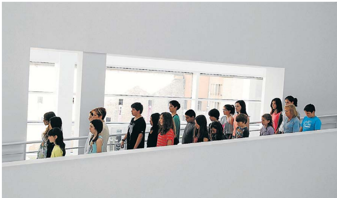
Alumnes i docents de l'institut Quatre Cantons baixen lentament per la rampa interior del Macba. Reflexionen sobre les normes que s'imposen als museus. EN RESIDÈNCIA

Ningú trobarà cap projecte artístic recent signat per Saladrigues que no reflexioni sobre la interacció que es produeix quan un, de forma buscada o per casualitat, s'acosta a l'art. Però si un procés de creació va marcar especial-