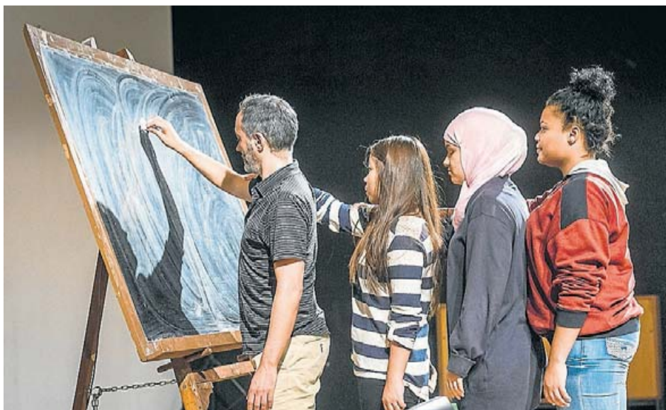
Los Corderos van treballar a l'Institut Milà i Fontanals. PEP HERRERO

Llavors sorgeixen obres artístiques que qüestionen sistemes com l'institut o la família, reflexionen sobre el barri on viuen –i que sovint desconeixen–, recuperen la memòria de la ciutat o posen paraules als pensaments que els preocupen com a persones en definició. També la forma que acaben prenent les cerques són diverses: exposicions plàstiques, performances , recitals de poesia, espectacles de dansa contemporània, peces de fang... “Al final aprenen que l'art no és només dibuixar o fer escultu-