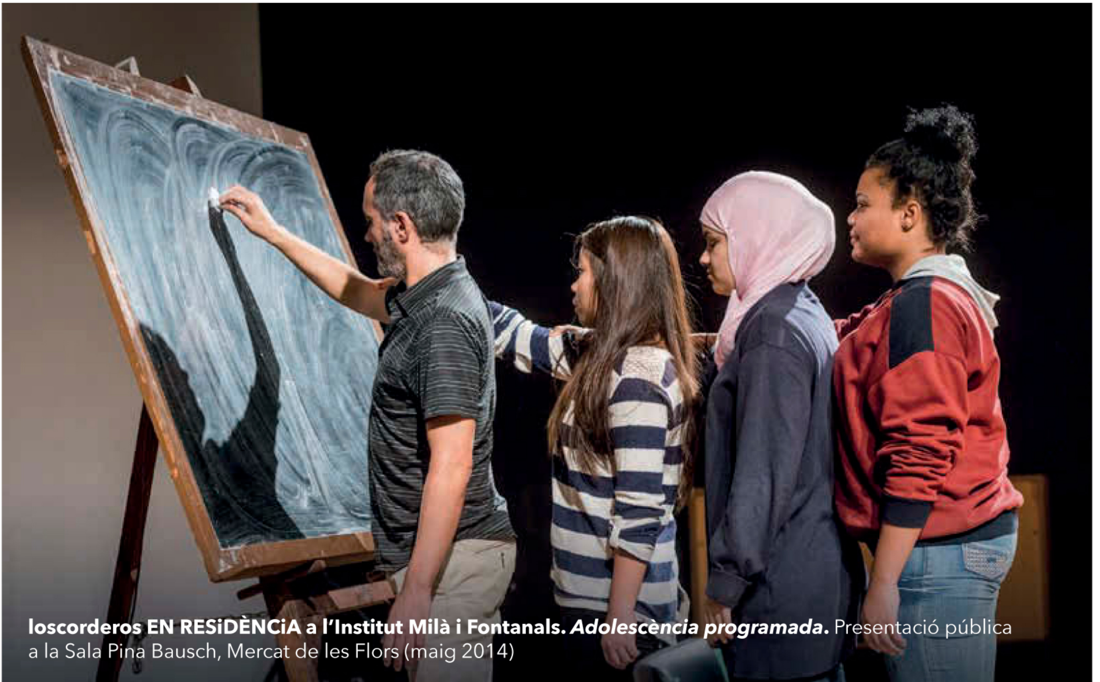
Ioscorderos EN RESIDÈNCIA a l'Institut Milà i Fontanals. Adolescència programada. Presentació pública a la Sala Pina Bausch, Mercat de les Flors (maig 2014)

dotze a setze anys) duen a terme, al llarg de tot el curs, un procés de creació d'un espectacle. Es fa en horari lectiu (és una assignatura optativa), s'avalua i compta amb la col·laboració de professors del centre. Volíem que alumnes i professors visquessin tot el procés que hi ha al darrere de la creació. El balanç és molt positiu, assegura. Tot i que arriba el moment en què els adolescents volen estar com més lluny millor dels adults, si construïm espais que se sentin com a propis (a partir de residències de creació o del que sigui), potser és més fàcil que no s'acabi de produir una ruptura.