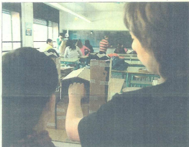
Els alumnes de l'Institut Valldemossa i Vicens Casassas fan diversos exercicis per preparar la seva intervenció urbana.

"Vam començar a investigar el seu passat i vam trobar antigues fotografies aèries en què es veia el vell manicomi, amb l'església, completament envoltats de camps; i també altres fotografies posteriors que s'havien fet durant la construcció dels edificis de la zona. Això ens va portar fins a la següent conclusió: que la idea de ciutat, que ens sembla una cosa tan sòlida, realment no ho és, perquè està