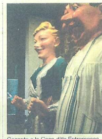
Gegants a la Casa dels Entremesos.

En residència és un programa de l'Institut de Cultura de Barcelona i del Consorci d'Educació de Barcelona, en cooperació amb l'associació A Bao A Qu i amb la col·laboració del Macba. Les obres i els processos de creació es poden veure a la web www.enresidencia.org .