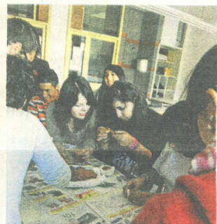
ESTUDIANTS DE L'IES BARCELONA-CONGRÉS AB

D es de setembre, diversos grups d'alumnes d'ESO de vuit centres públics de Barcelona han compartit una experiència inoblidable amb diversos artistes contemporanis: crear conjuntament una obra d'art, des de la fase inicial de concepció de la idea fins a la concreció final. La iniciativa, que es duu a terme des de fa dos cursos, s'ha anomenat "En residència", en al·lusió al trasllat metafòric que fan els artistes del seu estudi de treball a les aules dels centres docents durant tot un curs escolar. Es tracta d'un programa pioner a l'Estat espanyol que han impulsat l'Institut de Cultura i el Consorci d'Educació de Barcelona, en cooperació amb l'Associació A Bao A Qui i amb la col·laboració del Macba. A més, totes les obres realitzades s'exposen fins al pròxim 12 de maig al Fàbrik de Creació Fabra i Coats, a la mostra titulada Creadors En Residència als instituts de Barcelona .