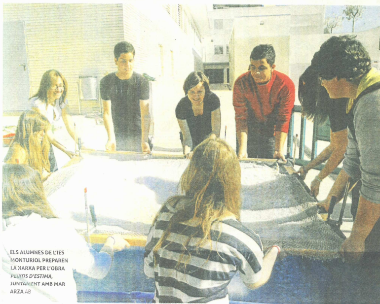
ELS ALUMNES DE L'IES MONTURIOL PREPAREN LA MARXA PER L'OBRA PEIXOS D'ESTIMA, JUNTAMENT AMB MAR ARZA AB

El projecte municipal En residència permet als alumnes de secundària de Barcelona crear una obra d'art en hores lectives al costat de coneguts artistes contemporanis