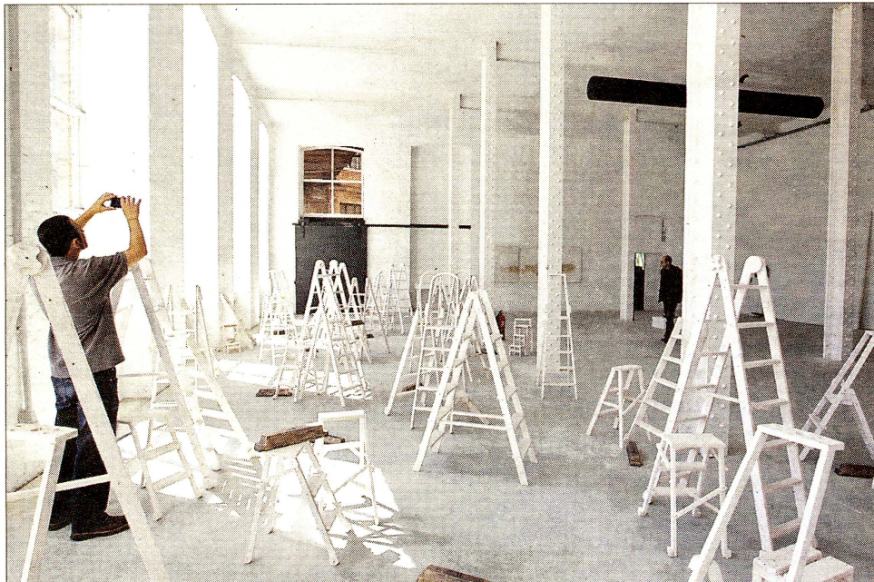
La sala de Fabra i Coats y, en primer término la instalación Deu mil hores.